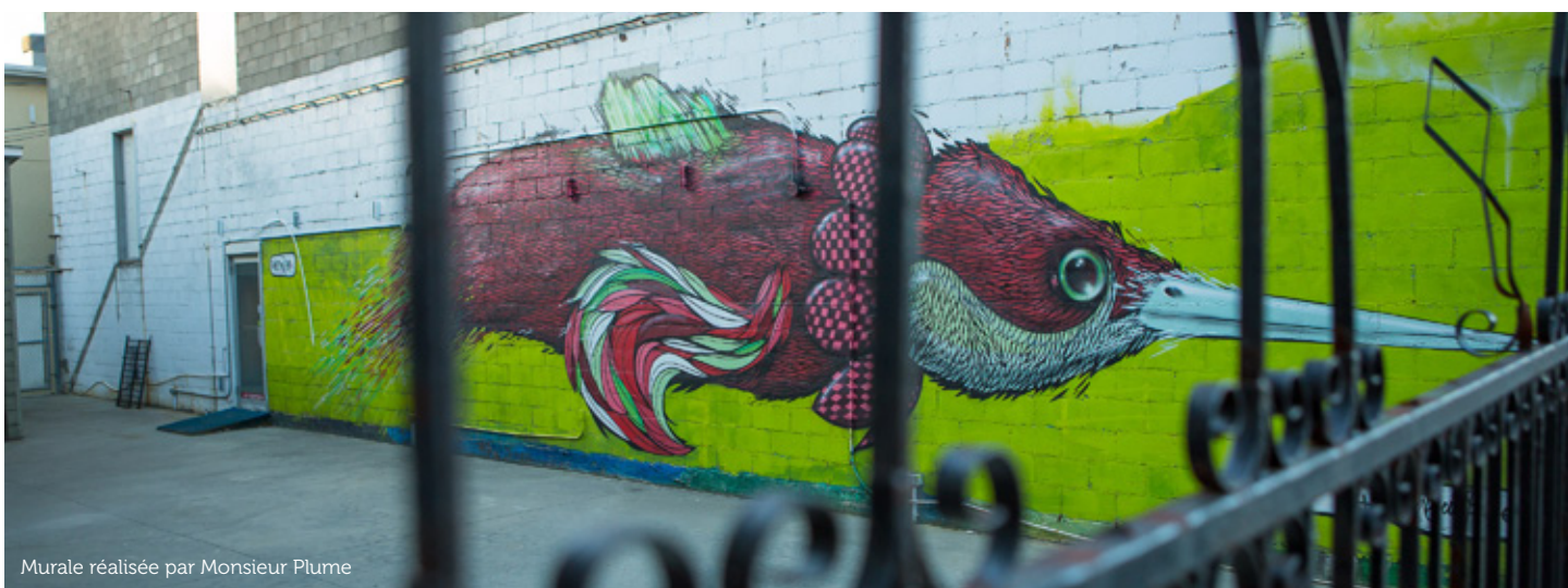
Murale réalisée par Monsieur Plume