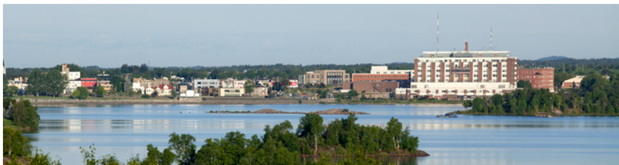
Vue sur Rouyn-Noranda